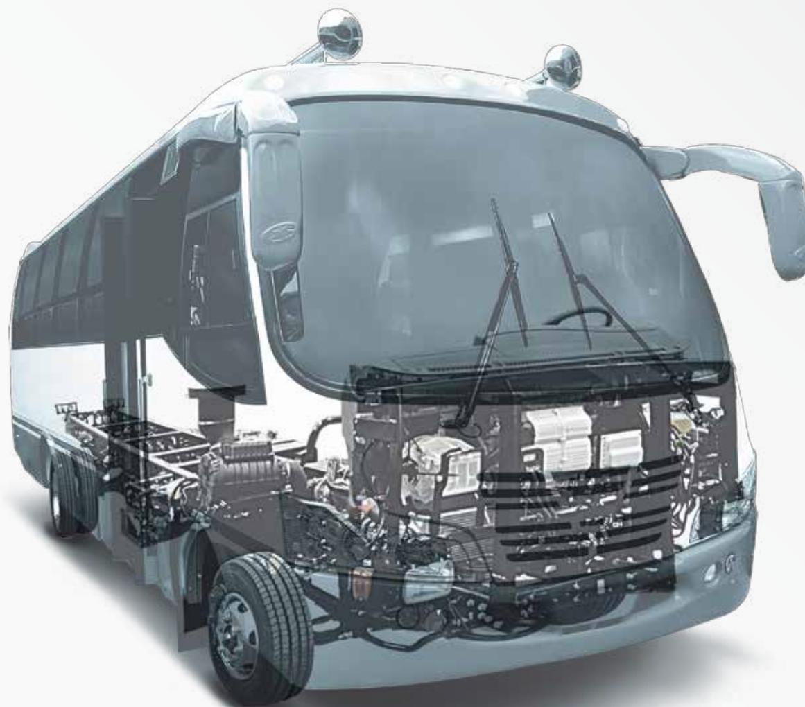
Foto de referencia, los accesorios no están incluidos en la versión básica - PPIV3789