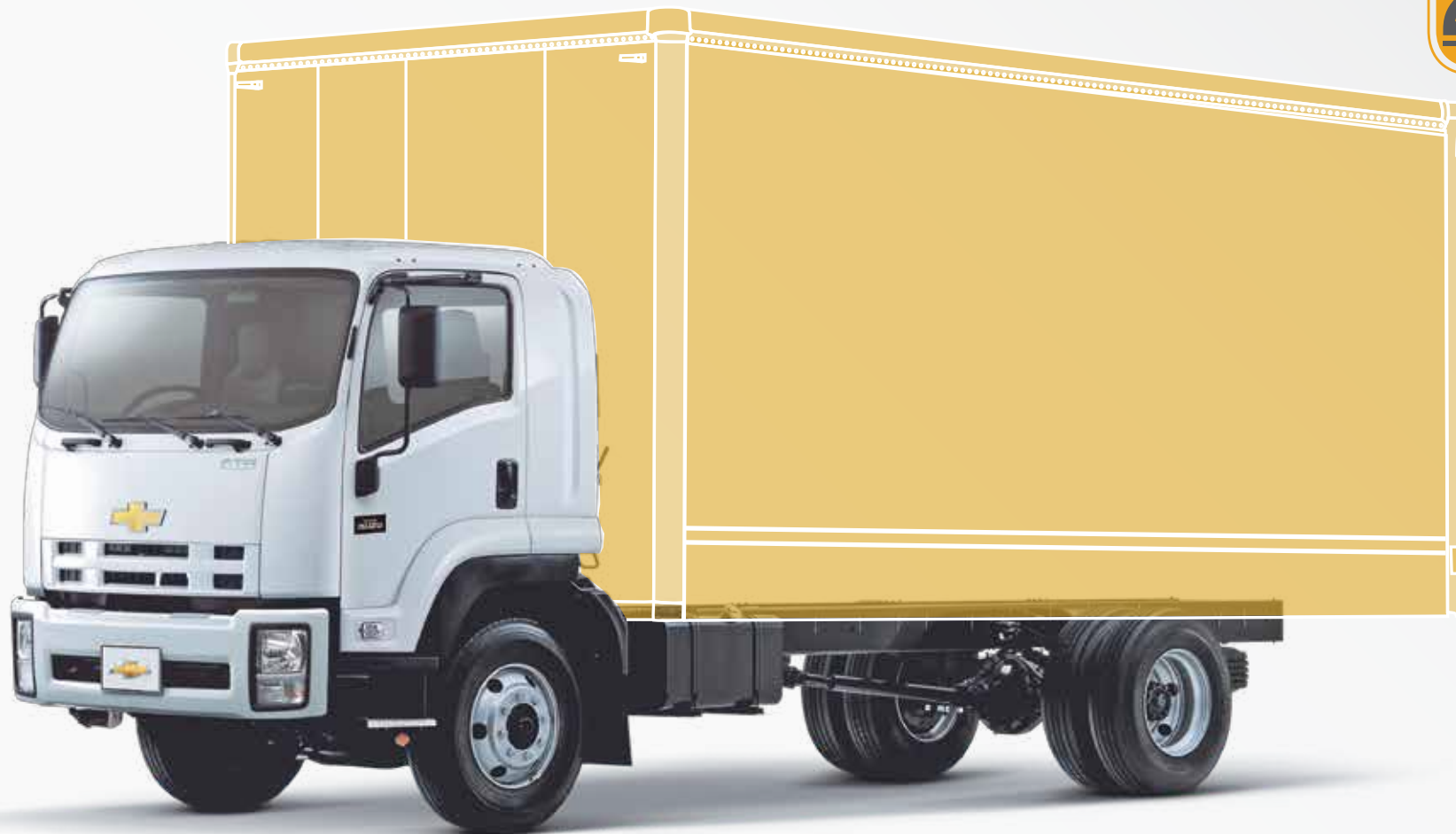
Foto de referencia, los accesorios no están incluidos en la versión básica - PPM3777